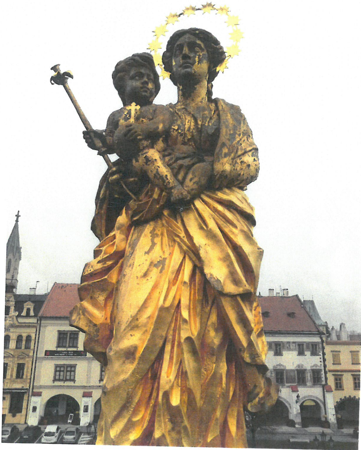
Čelní náhled sousoší