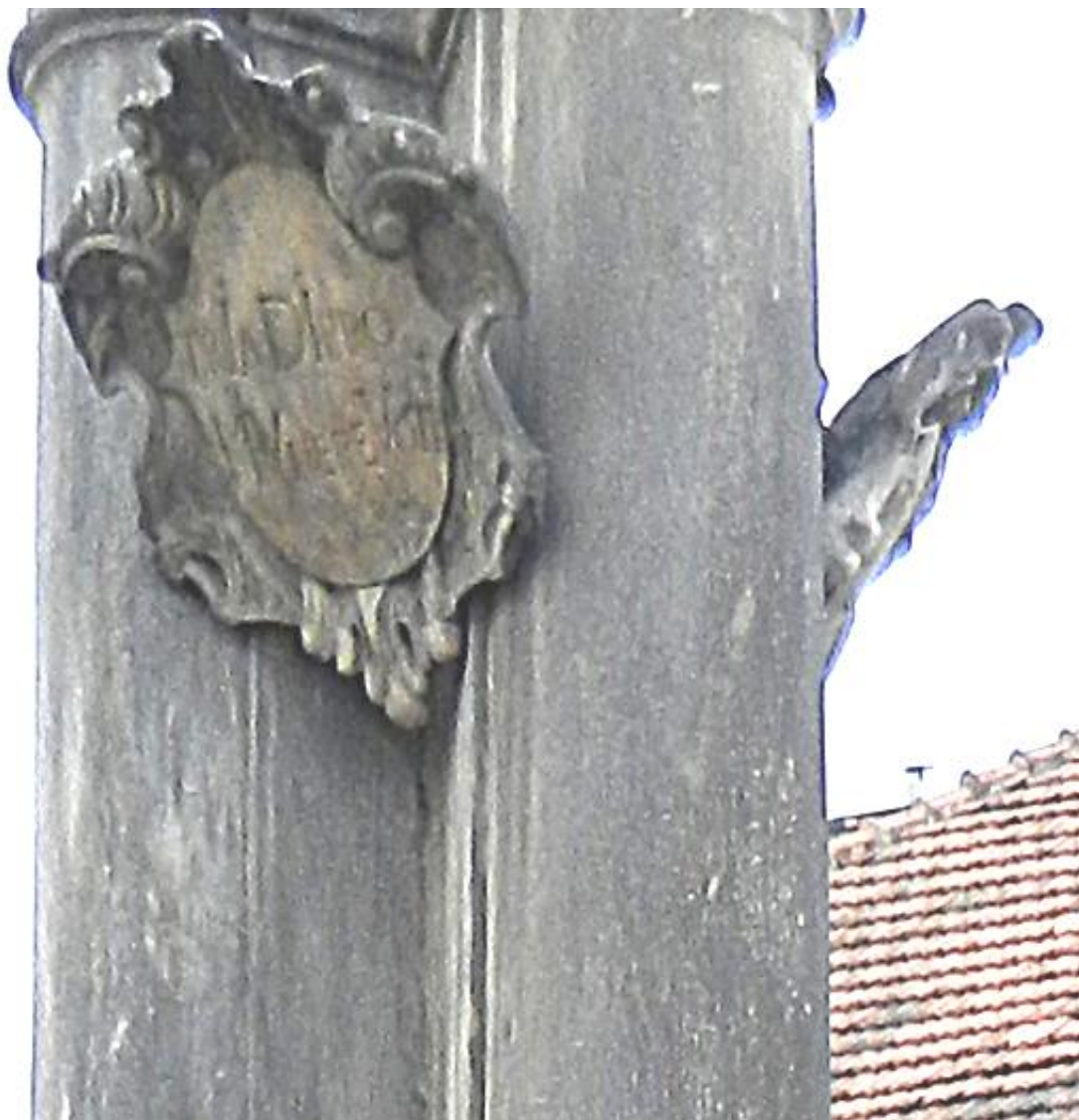
Kroměříž, sloup Nejsvětější Trojice, 2018 Detail kartuše na čelní straně sloupu. Stav před restaurováním.