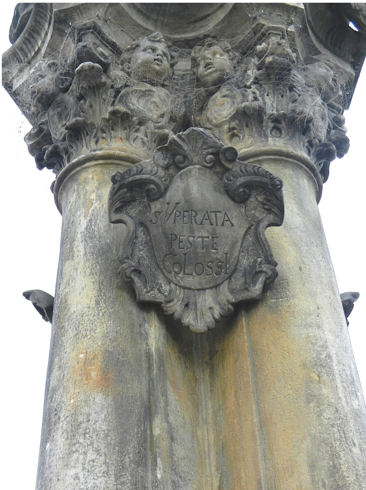
Kroměříž, sloup Nejsvětější Trojice, 2018

Levá strana sloupu s hlavicí a s kartuší, stav před restaurováním.