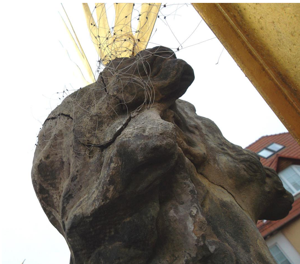
Kroměříž, sloup Nejsvětější Trojice, 2018

Detaily hlavy Ježíše Krista s otevřenými trhlinami. Stav před zahájením restaurování.