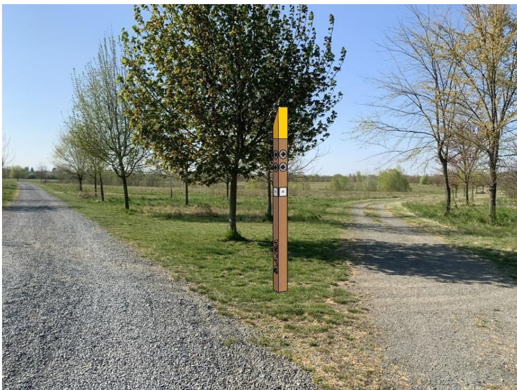
Obr.č.2.-Pozemek s parcelním číslem 4680