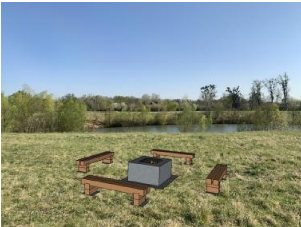
Obr.č.12.-Pozemek s parcelním číslem 4681, ohniště bez kameniva