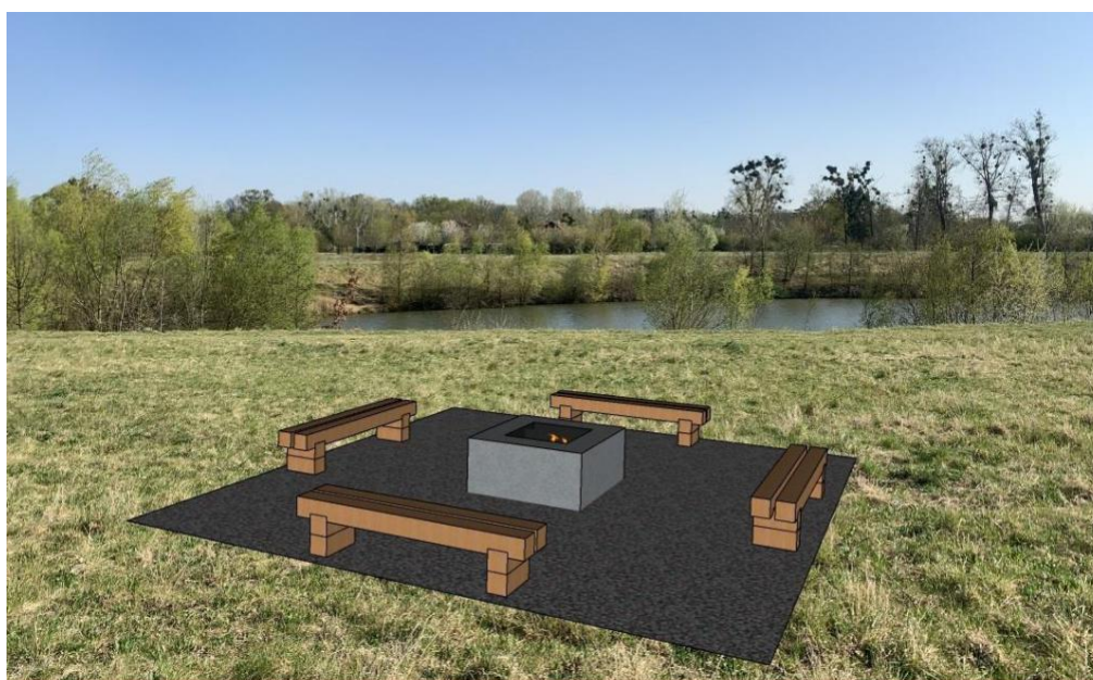
Obr.č.13.-Pozemek s parcelním číslem 4681, ohniště s kamenivem