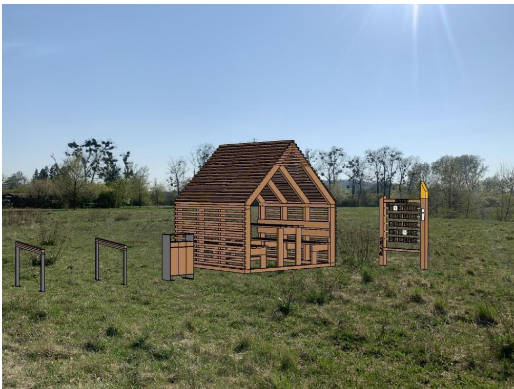
Obr.č.8.-Pozemek s parcelním číslem 4681