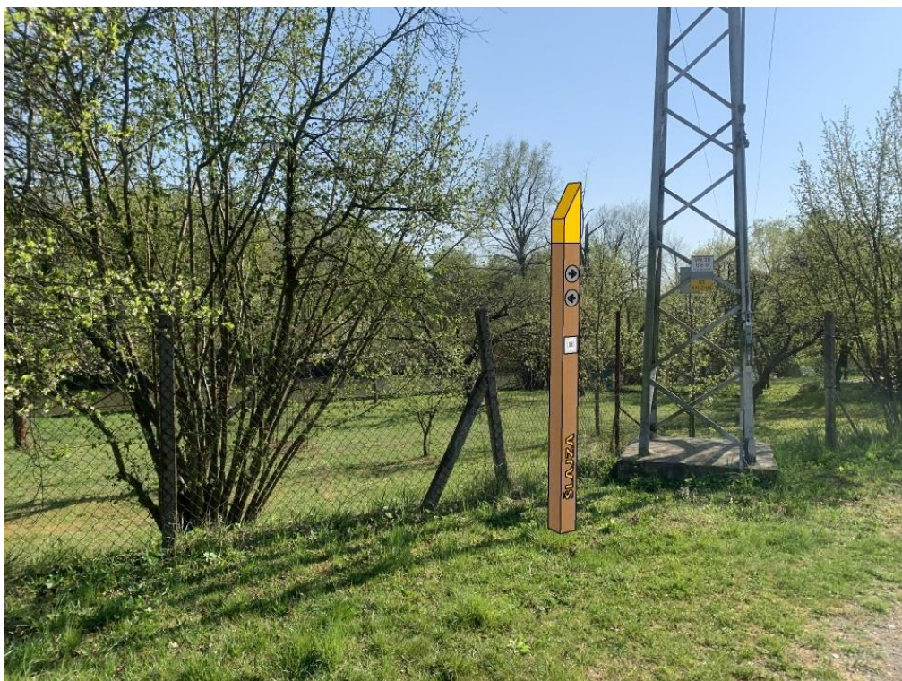
Obr.č.3.-Pozemek s parcelním číslem 4919