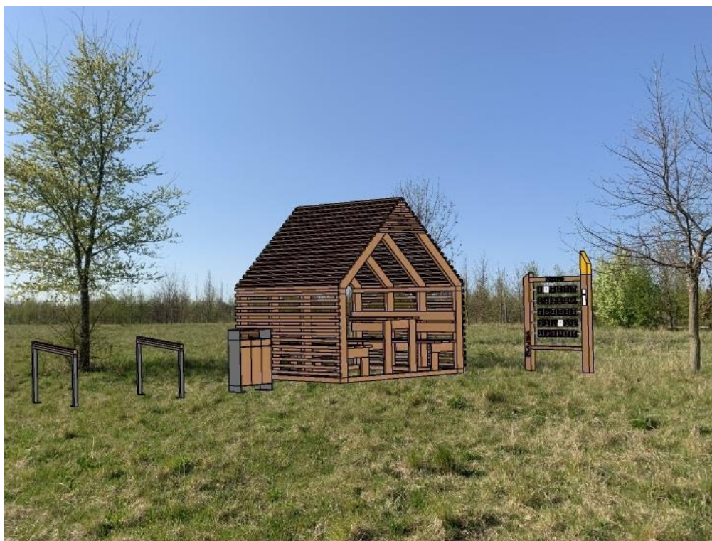
Obr.č.7.-Pozemek s parcelním číslem 4681

Konstrukce i vnitřní prostor přístřešku je tvořen z masivního dřeva. Konstrukce umožňuje pohodlné usazení až 6 - ti osob. Opláštění celé konstrukce je pomocí dřevěných latí, a to i v střešní části, zde plní stínící, částečně krycí a designovou funkci. V případě krycí funkce je zapotřebí pokrytí střešní roviny plexi sklem či zvolit jiné provedení střešního pláště.