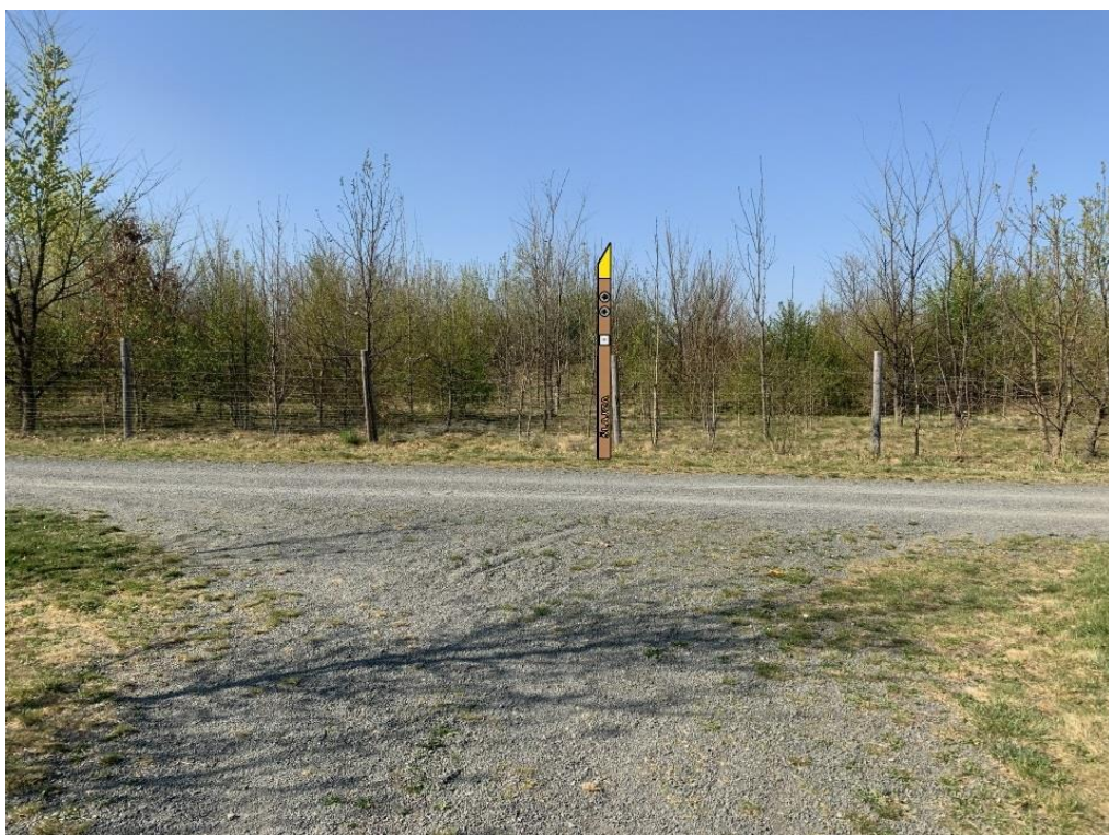
Obr.č.6.-Pozemek s parcelním číslem 4681