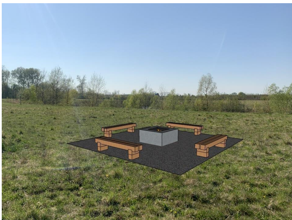
Obr.č.11.-Pozemek s parcelním číslem 4681, ohniště s kamenivem