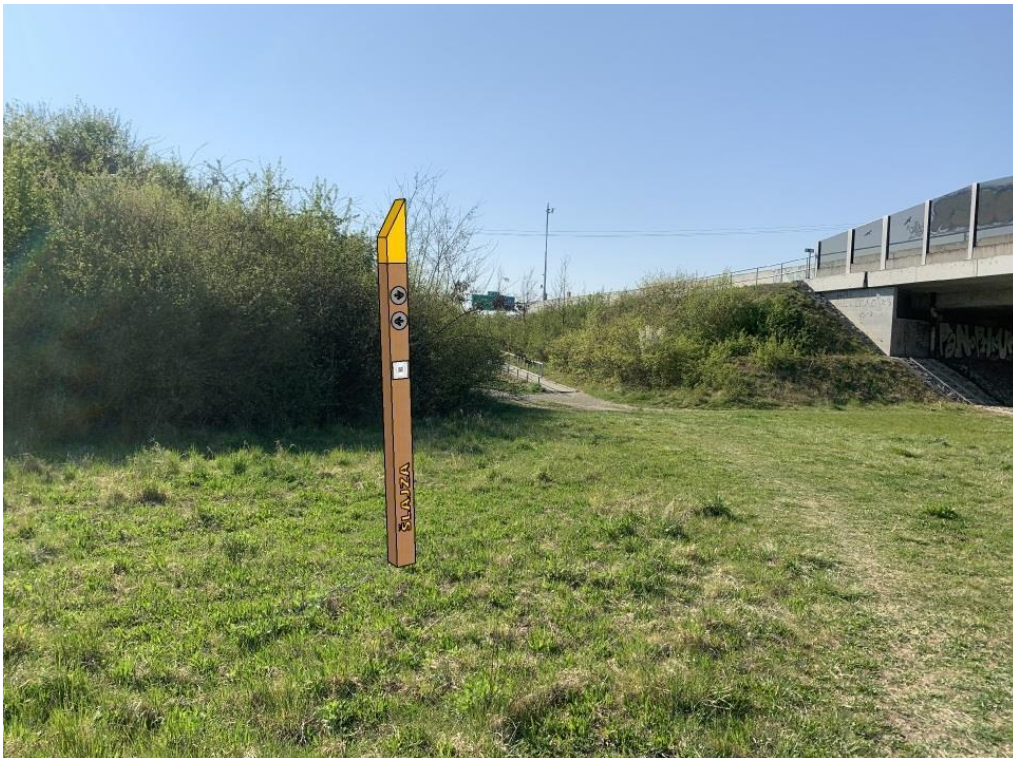
Obr.č.5.-Pozemek s parcelním číslem 4678