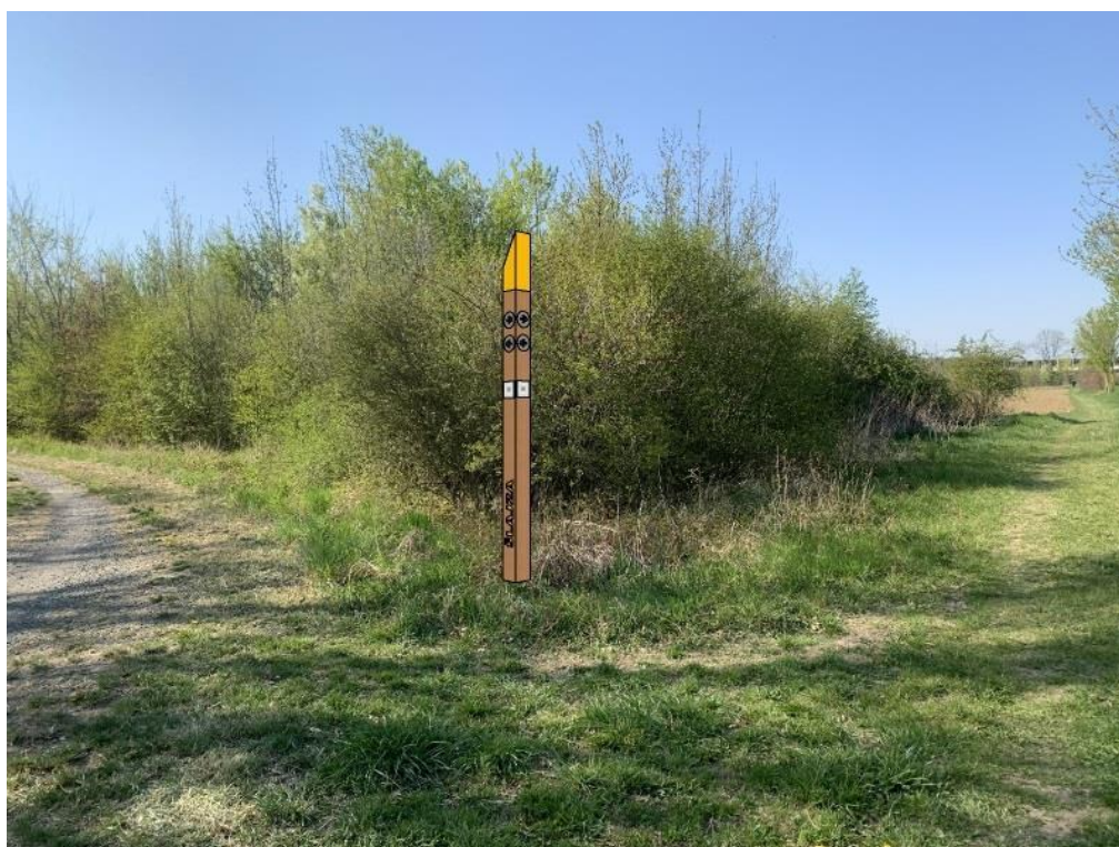
Obr.č.4.-Pozemek s parcelním číslem 4665