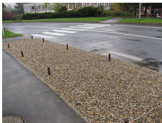
Vzorový záhon po výsadbě s minerálním mulčem.