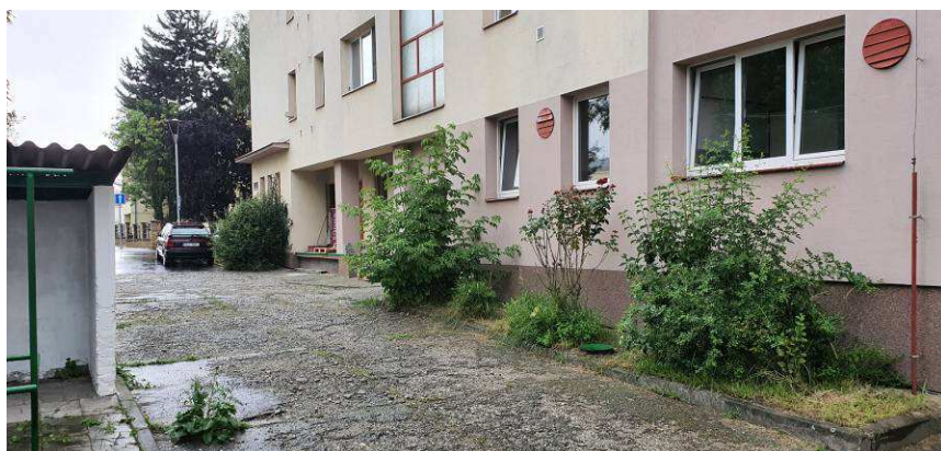
Lokalita 2 – Ulice Generála Svobody