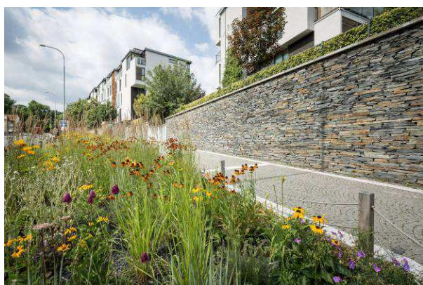
Ilustrační obrázek záhonu.

V rozvojové péči bude záhon vyplet, jsou odstraněny odkvetlé a odumřelé části rostlin. V prvním roce po výsadbě bude záhon plet 4-6x ročně. V žádném případě nesmí být narušován uzavřený půdní povrch. V případě potřeby proběhne také zálivka.