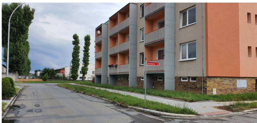
Lokalita 4 – Vnitroblok a stromořadí Zeyerova