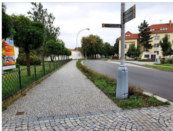
Lokalita 3 – Sídliště Axmanova